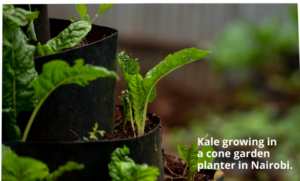
Kale growing in a cone garden planter in Nairobi.

Finally, pray over your cone garden for God's help with these commitments to act. If you're using soil, you can plant seeds such as salad leaves around your prayers and actions.